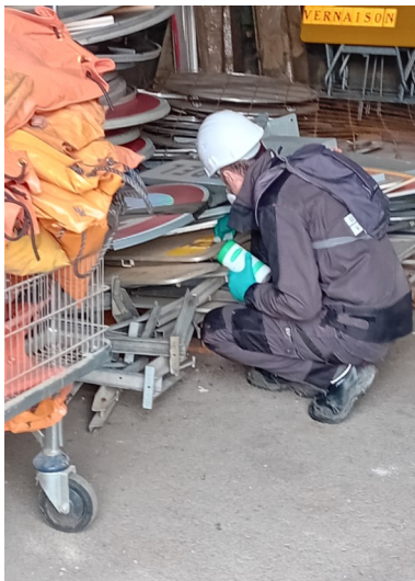
EST - PANNEAU CHANTIER