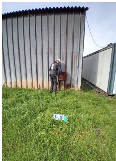
EST - EXTERIEUR BARBECUE