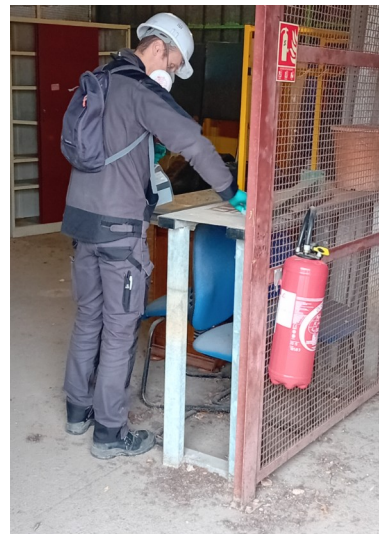
OUEST - HANGAR CONSOLE