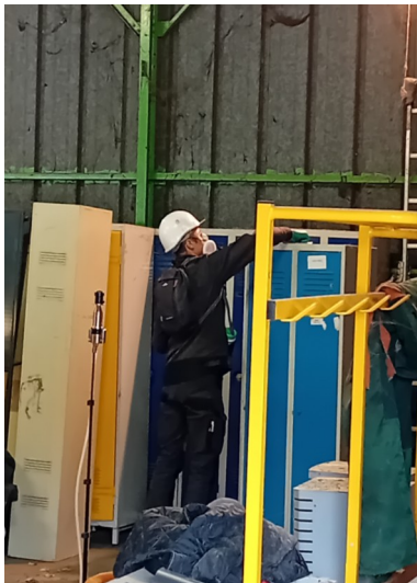
OUEST - HANGAR DESSUS ETAGERE