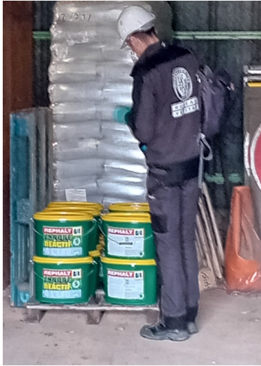
OUEST- HANGAR SCEAU VERT/JAUNE ENROBE